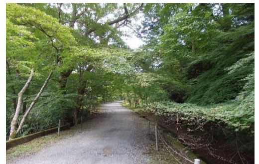
三井寺境内のもみじ(晩秋に紅葉)

*新型コロナウイルスの状況・悪天候等により中止する場合がありますので、事前ご了解をお願いします。