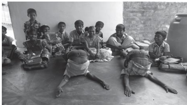
子どもたちのヨガ (インド・タミルナード州)